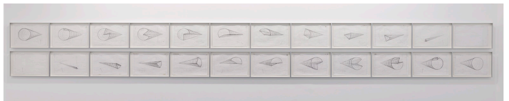
Anthony McCall Leaving (With Two-Minute Silence) , 2006-8

Double installation avec son. Durée : 32-minutes (3 éditions).