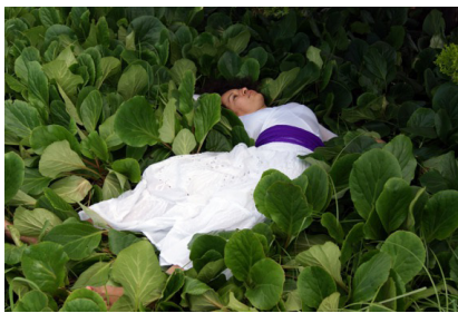
Sonia Boyce, Dance of Belem , avec Vania Gala (performer-choreographer), 2013, vidéo